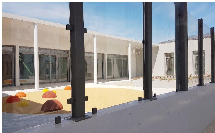
Fin de la construction du nouvel équipement